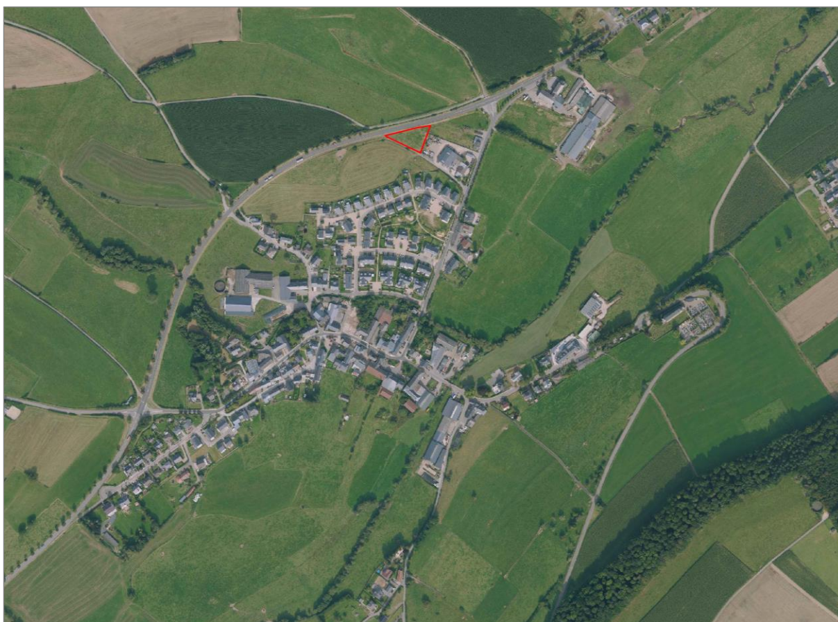
Abb. 1: Abgrenzung des Plangebietes der punktuellen PAP QE-Änderung (rot) im Norden von Oberfeulen.

Im aktuell rechtsgültigen PAP „Quartier existant“ der Gemeinde Feulen liegt das Plangebiet außerhalb des Geltungsbereiches des PAP „Quartier existant“. Entsprechend den geplanten Ausweisungen des PAG modifié soll die Fläche in den Geltungsbereich des PAP „Quartier existant“ fallen und entsprechend der Grundzonierung der angrenzenden Gewerbezone „Nordparts“ als „Quartier existant - activités“ (QE_A) ausgewiesen werden.