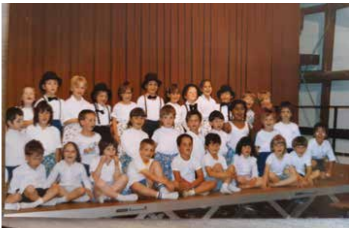
Fête des élèves au Hennesbau, 1986