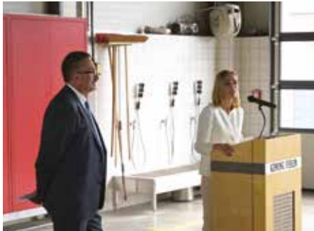
Madamm Minister Taina Bofferding