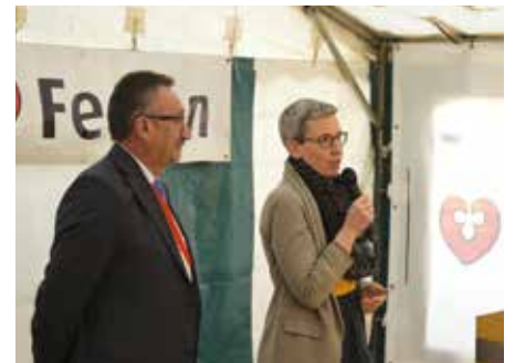
Madamm Minister Sam Tanson