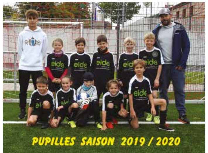
PUPILLES SAISON 2019 / 2020