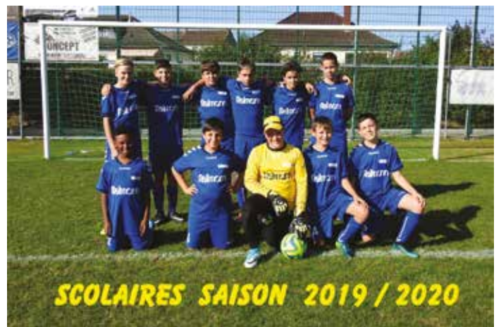
SCOLAIRES SAISON 2019 / 2020

Hutt Dir och een Kand (ab 5 Joer) wat interesséiert ass an Spaass um Fussball spillen huet, kënt Dir lech gäre via Mail: usfeulen@pt.lu oder um Nummer: 621 22 88 68 mellen