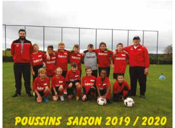
POUSSINS SAISON 2019 / 2020