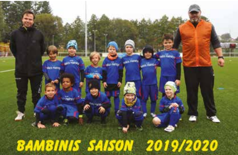
BAMBINIS SAISON 2019/2020