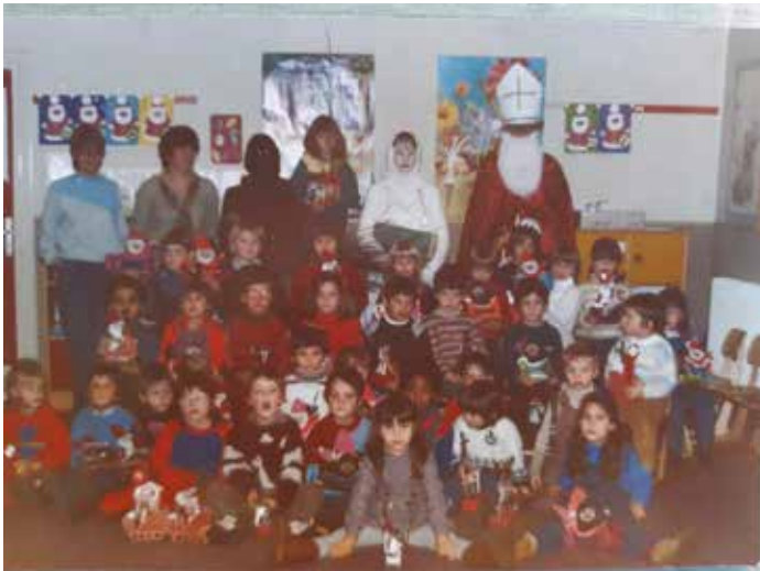
Photo de l'école à Niederfeulen avec Saint Nicolas (Kleeschchen): Cycle 2 (1986-87)

Les élèves ne rataient aucune occasion de se réunir pour faire la fête! Merci à une habitante, native de la commune de Feulen, d'avoir partagé ses joyeux souvenirs.