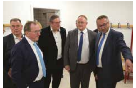
Här Minister Romain Schneider