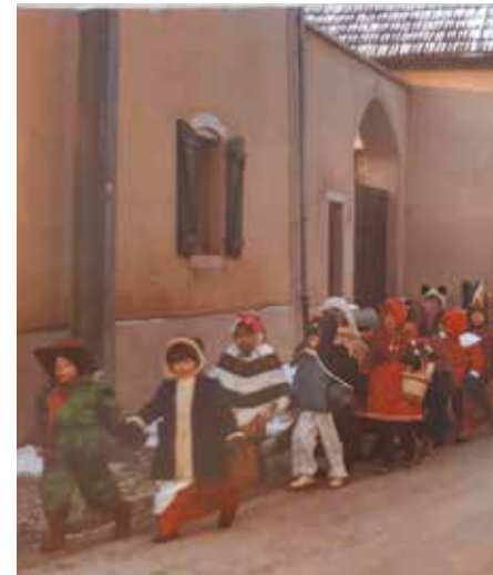
Photos „Fetten Donneschden“ 1985: cortège rue Eugène Reiser Niederfeulen et route de Colmar Berg Oberfeulen