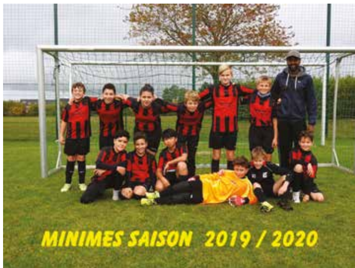
MINIMES SAISON 2019 / 2020