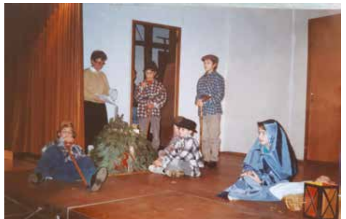
Crèche de Noël, salle des fêtes de l'ancienne école de Niederfeulen, 1987 ou 1988