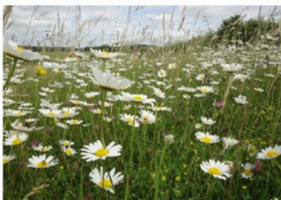
Les prairies riches en espèces dépendent de l'exploitation extensive.

SICONA procède au monitoring botanique depuis 2013 afin de documenter l'évolution des espèces de plantes typiques dans les prairies et champs riches en espèces. Ce travail est financé par les communes et est pris en compte dans le cadre du Pacte nature. Le recensement démontre que beaucoup d'espèces de plantes marquantes ont pu être sauvegardées grâce à l'exploitation extensive et que les programmes de biodiversité portent leurs fruits. Les prairies et champs riches en espèces ont une véritable plus-value pour l'être humain, leur sauvegarde et restauration sont essentielles.